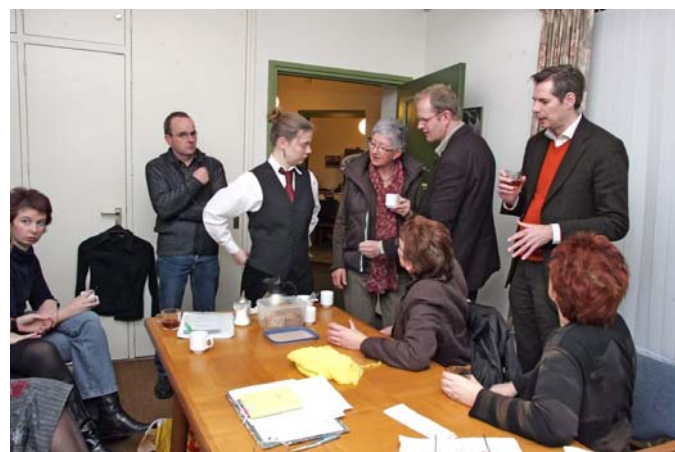
De kledinggroep kleedt de toneelgroep